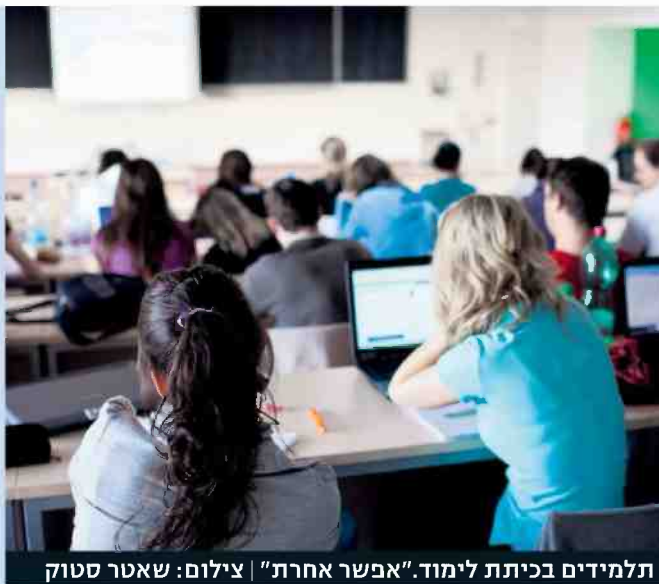
תלמידים בכיתה לימוד "אפשר אחרת"

איך העבודה עם המגזר הברואי? "במשך הרבה שנים אני עובדת עם סטודנטים ברואים. אני מאוד אוהבת את הלמידה שלהם. אני רואה שיש להם ניצוץ בעיניים כשהם לומדים. יש להם מוטיבציה להצליח. נושא החינוך קרוב לליבם, והוא נמצא במיקום די גבוה בסדר העדיפויות. צריך לעזור להם ולקדם אותם. צריך לתת להם תחושת מסוגלות, שהם יכולים להשקיע מאמץ שיישא פירות. יש להשקיע גם בתשתיות פיזיות וגם בתשתיות חינוכיות כדי לסייע להם לממש את היכולות שלהם. הדור שאני מכשירה יהיה, לרעתי, גם הדור שיע